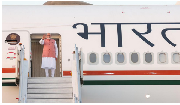
ప్రధానమంత్రి నరేంద్ర మోదీ గురువారం ఆరవ బిమ్స్టెక్ శిఖరాగ్ర సమావేశంలో పాల్గొనడానికి థాయిలాండ్ కు బయలుదేరి వెళ్లారు. ఆ తర్వాత ఆయన శ్రీలంకకు కొత్త అధ్యక్షుడు అనుర

కుమార దిసానాయకను కలవనున్నారు. దిసానాయకే అధ్యక్షుడిగా ఎన్నికైన తర్వాత ఆ దేశాన్ని మోదీ సందర్శించడం ఇదే తొలిసారి. ఈ పర్యటన సందర్భంగా ప్రధానమంత్రి పేటోంగ్ టార్న్ షివవత్రా, థాయ్ నాయకత్వంతో మోదీ సమావేశమయ్యే అవకాశం ఉంది. ఉమ్మడి సంస్కృతి, తత్వశాస్త్రం, ఆధ్యాత్మిక ఆలోచనలు వంటి బలమైన పునాదులపై ఆధారపడిన వారి దీర్ఘకాల చారిత్రక సంబంధాలను మెరుగుపరుచుకోవాలని లక్ష్యంతో మోదీ ఈ పర్యటన చేయనున్నట్లు పేర్కొన్నారు. గత దశాబ్దంలో బంగాళాఖాతం ప్రాంతంలో ప్రాంతీయ అభివృద్ధి, కనెక్టివిటీ మరియు ఆర్థిక పురోగతిని ప్రోత్సహించడానికి బిమ్స్టెక్ (బీ ఆఫ్ బెంగాల్ ఇనిషియేటివ్ ఫర్ మల్టీ-సెక్టర్ల టెక్నికల్ అండ్ ఎకనామిక్ కోఆపరేషన్) ఒక ముఖ్యమైన వేదికగా మోదీ