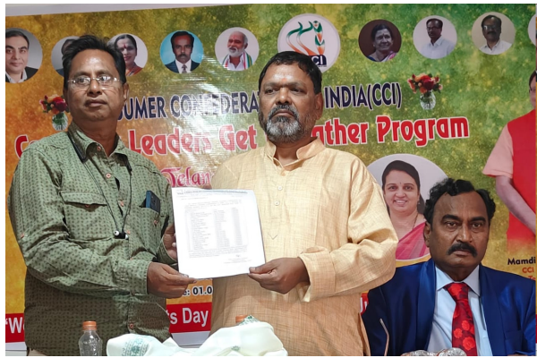
షాద్ నగర్ తెలంగాణ లెజిస్లేట్ ప్రతినిధి :