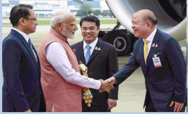
బిమ్మిటెక్ సదస్సులో భాగంగా ప్రధాని మోడీ థామ్ లాండ్ లో పర్యటిస్తున్నారు. ఈ సందర్భంగా ఆ దేశ ప్రధాని పేపేర్ గాట్లర్

షివపత్రాతో భేటీ అయ్యారు. థామ్ ప్రజల జీవితాల్లో రామాయణ ఇతిహాసం లోని గాథలు భాగమని మోడీ అన్నారు. దక్షిణాసియా, ఆగ్నేయాసియా ప్రాంతాలకు చెందిన 7 దేశాల సమాగమం అయిన బంగాళాఖాత ప్రాంత బహుళ రంగ, సాంకేతిక, ఆర్థిక సహకార (బిమ్మిటెక్) సదస్సు కోసం రెండు రోజుల పాటు గురువారం మోడీ థామ్ లాండ్ కు వెళ్లారు. ప్రధానుల భేటీ తరువాత మోడీ మాట్లాడుతూ “ భారత్ థామ్ లాండ్ మధ్య శతాబ్దాలుగా సంబంధాలు కొనసాగుతున్నాయి. సాంస్కృతిక, ఆధ్యాత్మిక సంబంధాలతో బలమైన బంధం ఏర్పడింది. బౌద్ధమతం వ్యాప్తి మన ప్రజలను అనుసంధానించింది. ఆయుతయ నుంచి నలంద వరకు మేధావులు రాకపోకలు సాగించారు. రామాయణ గాథలు